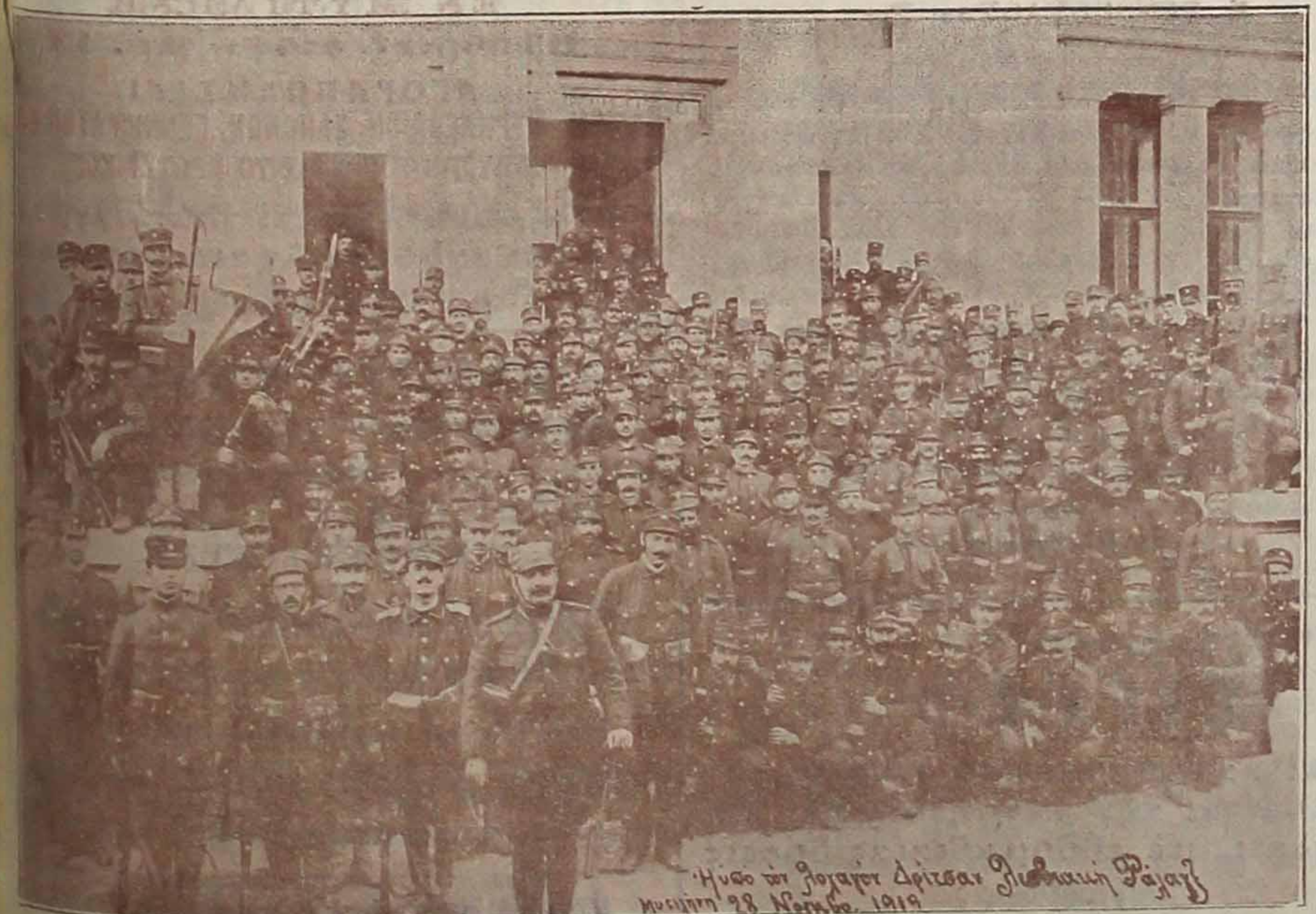
Ημερομηνία 28 Σεπτεμβρίου 1919